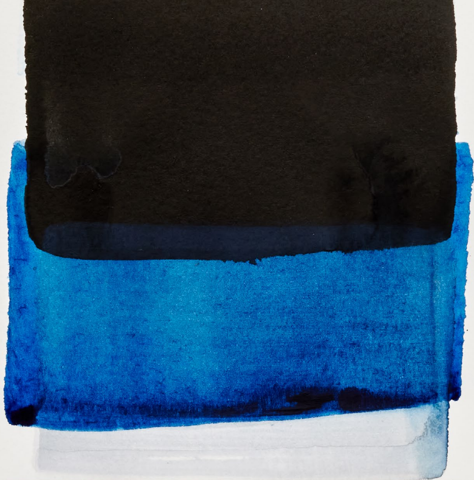
Détail de l'œuvre présentée en page 54