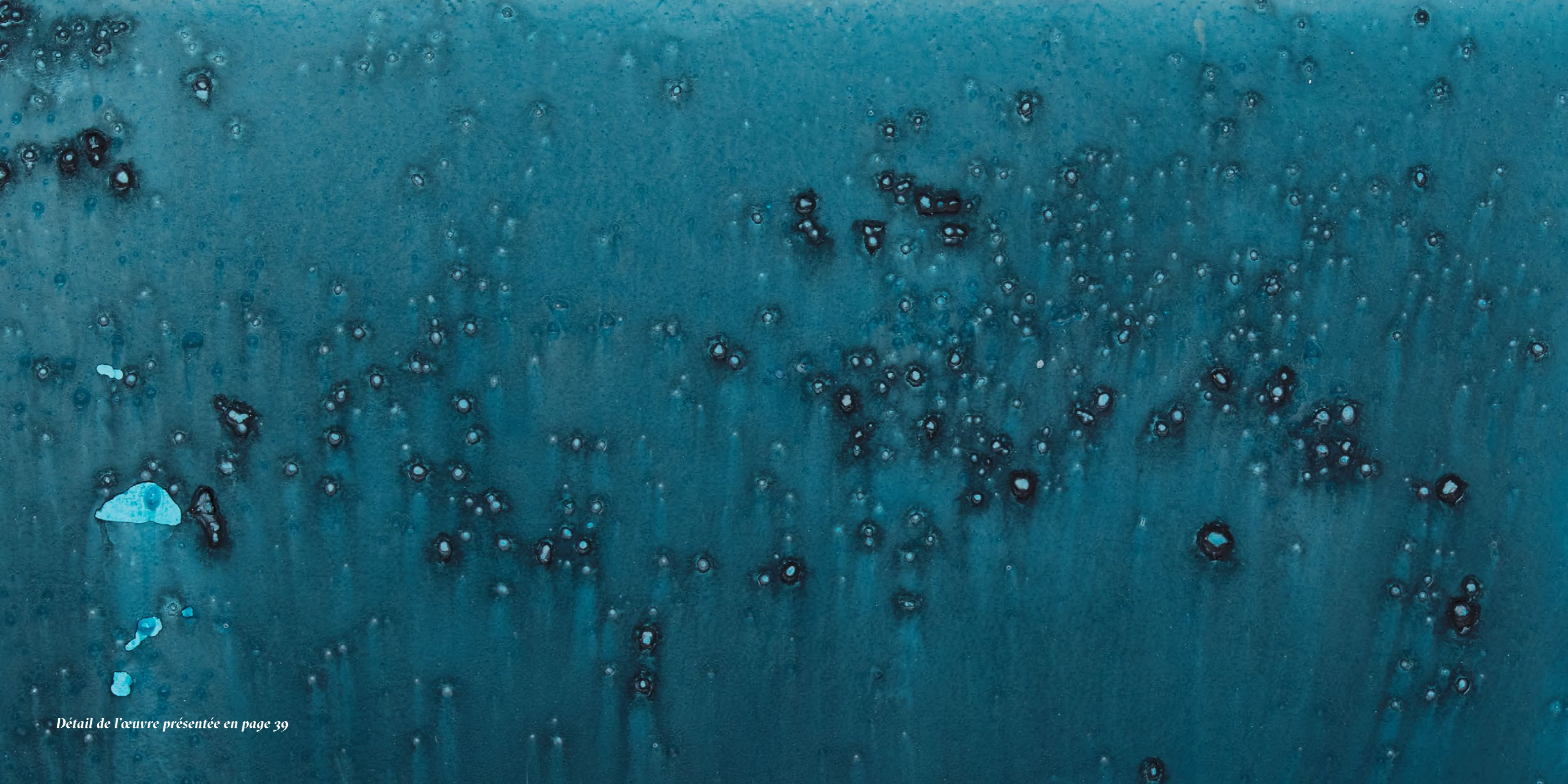
Détail de l'œuvre présentée en page 39